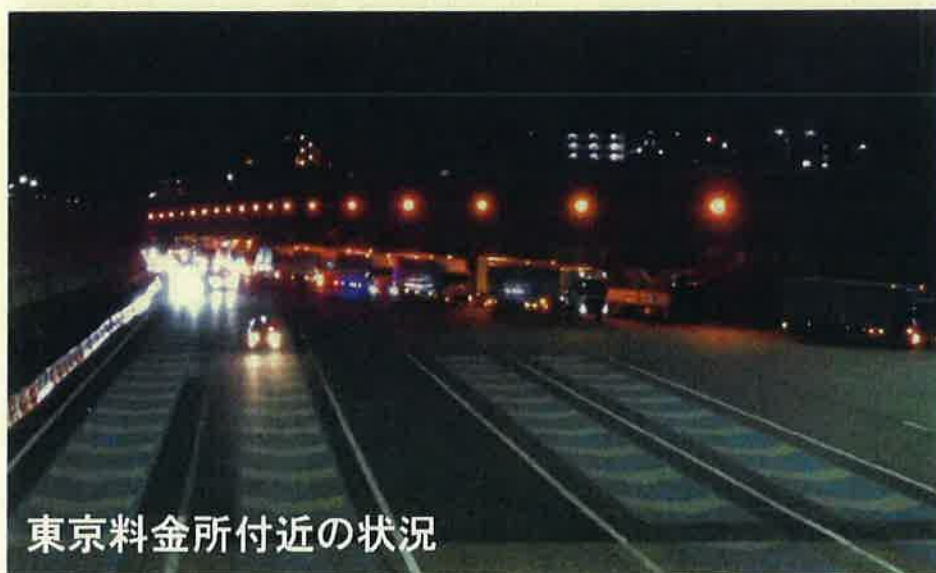
東京料金所付近の状況

高速道路上は、道路交通法により駐停車禁止です。 路肩や路側帯での駐停車は、道路交通法の罰則対象になる だけでなく、料金所を通過する車両の妨げとなり、 重大な 事故につながる可能性があるため非常に危険です！ 路肩や路側帯での駐停車を行わずに、手前のサービスエリア・ パーキングエリアをご利用ください。